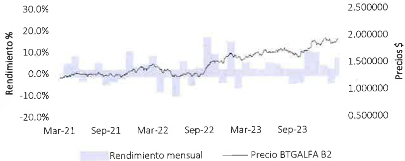
BTGALFA SERIE B2

1 Información actualizada al 27 de marzo de 2024.